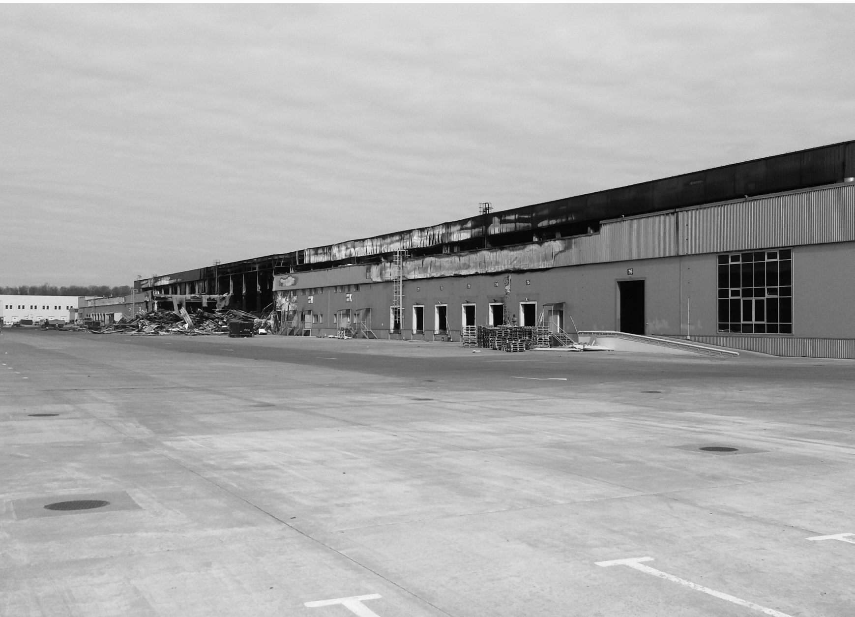
Plateforme logistique, Brovary, 26/03/22