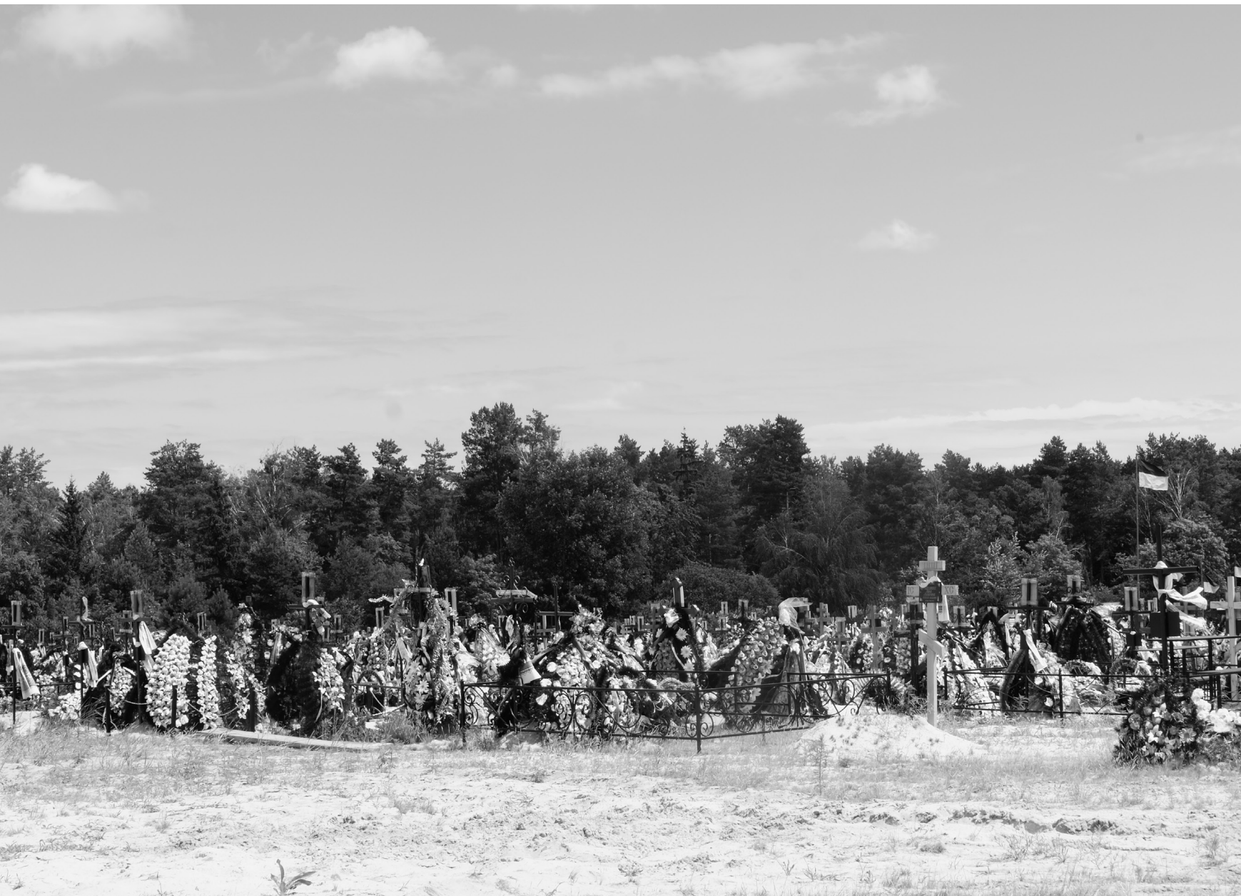
Cimetière, Irpin, 19/08/22