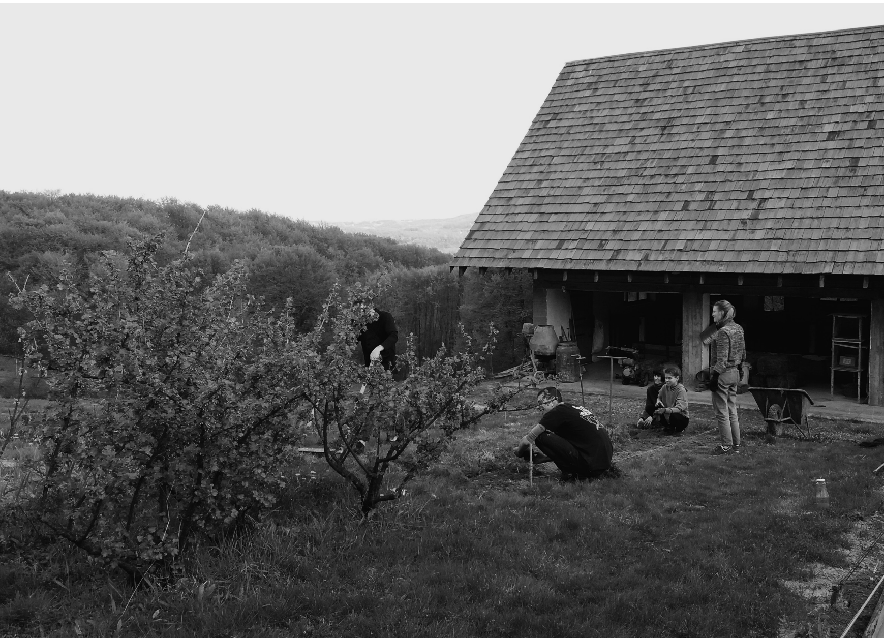
Ferme de Longo Mái, Hameau de Zeleny Hai, Nijnié Sélichché, 20/04/22

Des jeunes de Kyiv aident à travailler la terre.