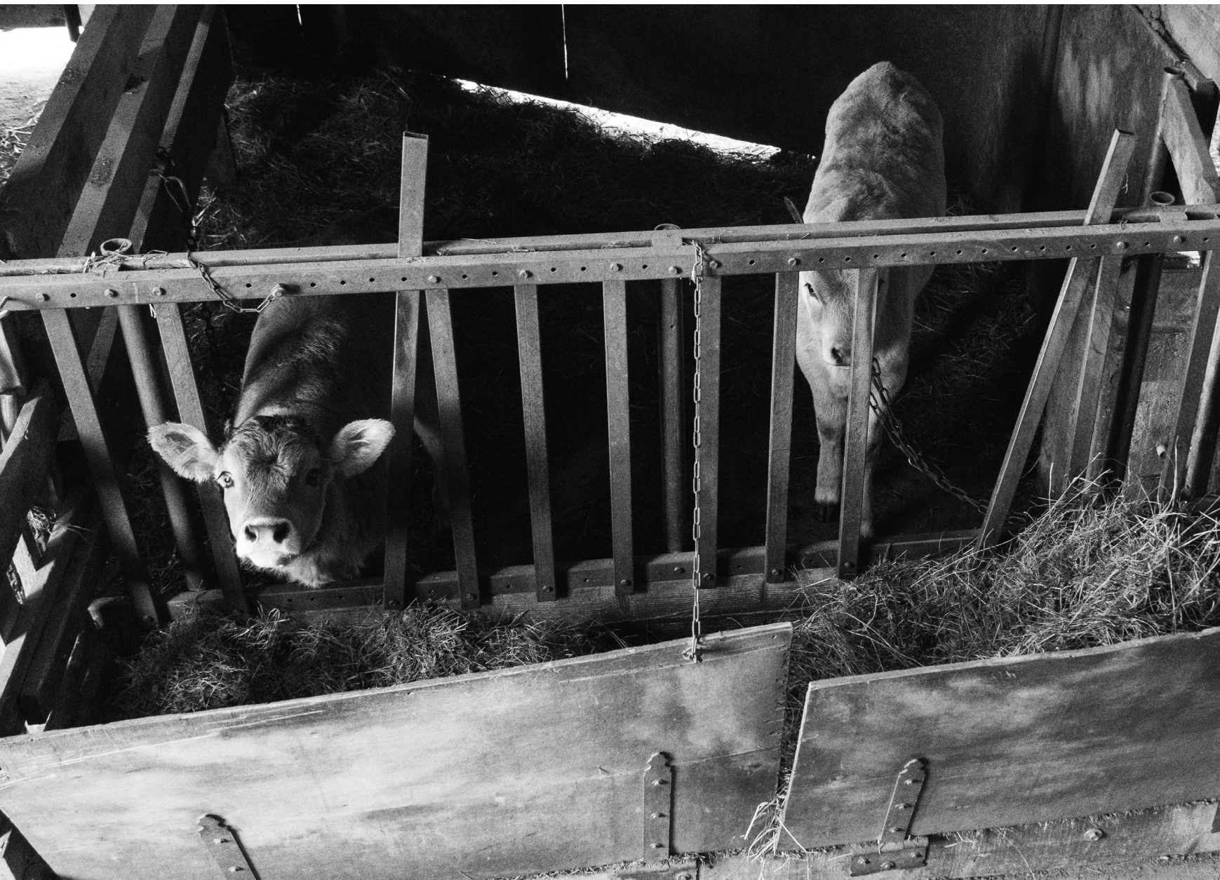
Ferme de Longo Măi, Hameau de Zeleny Hai, Nijnié Sélitchché, 18/03/22

Les animaux de la ferme sont nourris par les volontaires.