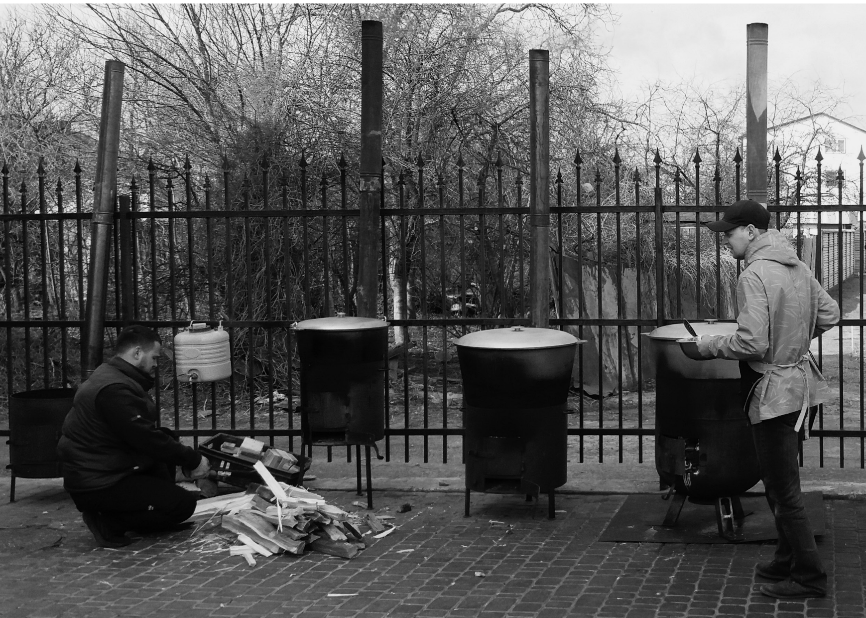
Lac de Radunka, près de l'église évangéliste Druzy Christa, rue Raiduzhna, Kyiv, 26/03/22

La soupe du midi se prépare pour les habitant-es du quartier.