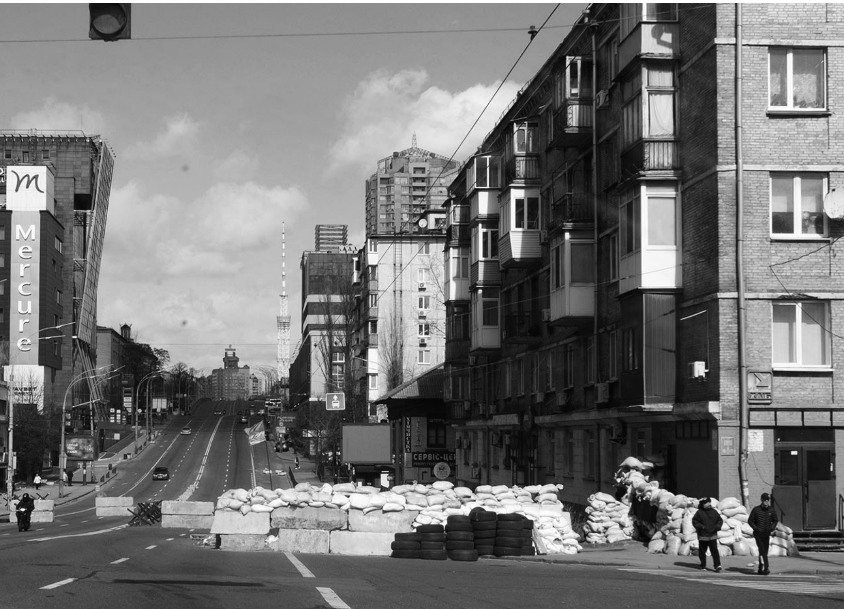
Voiture de Sergi, un checkpoint de Kyiv, 26/03/22

Rendez-vous pour mettre en place une cantine.