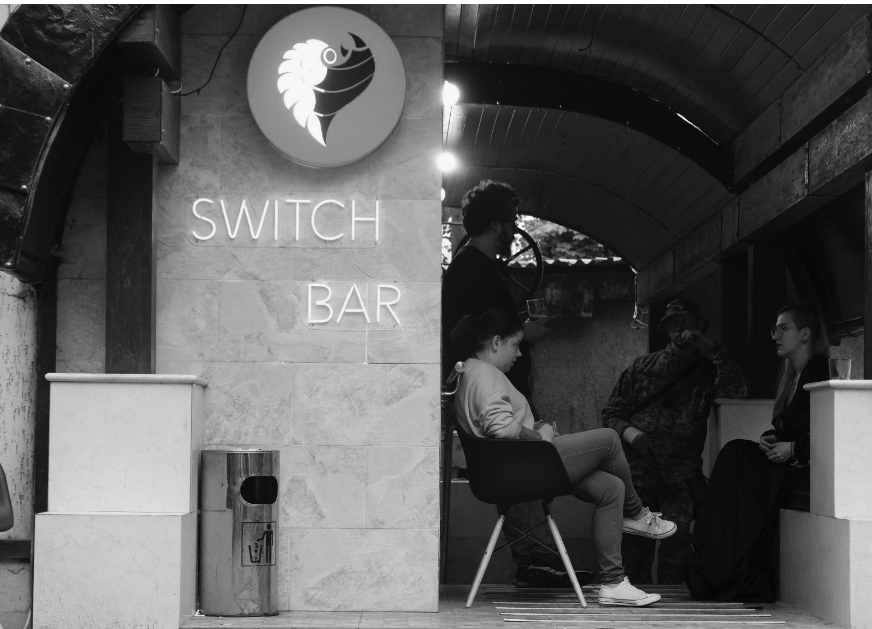
Switch Bar, Kharkiv, 20/07/22

Un groupe de jeunes volontaires vit dans le bar depuis le début de la guerre.