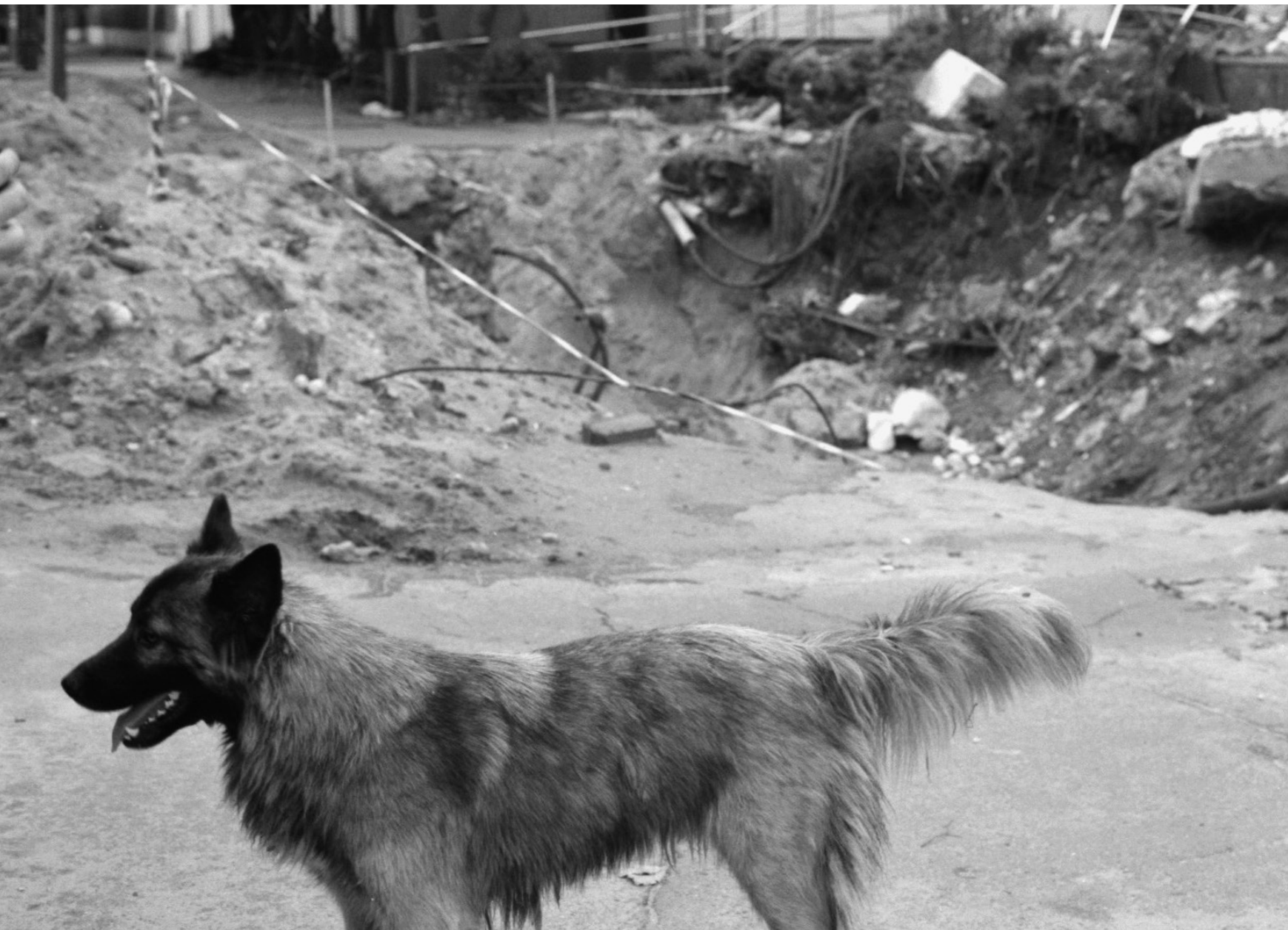
Eu bordure de la ville, Mykolajiv, 13/08/22