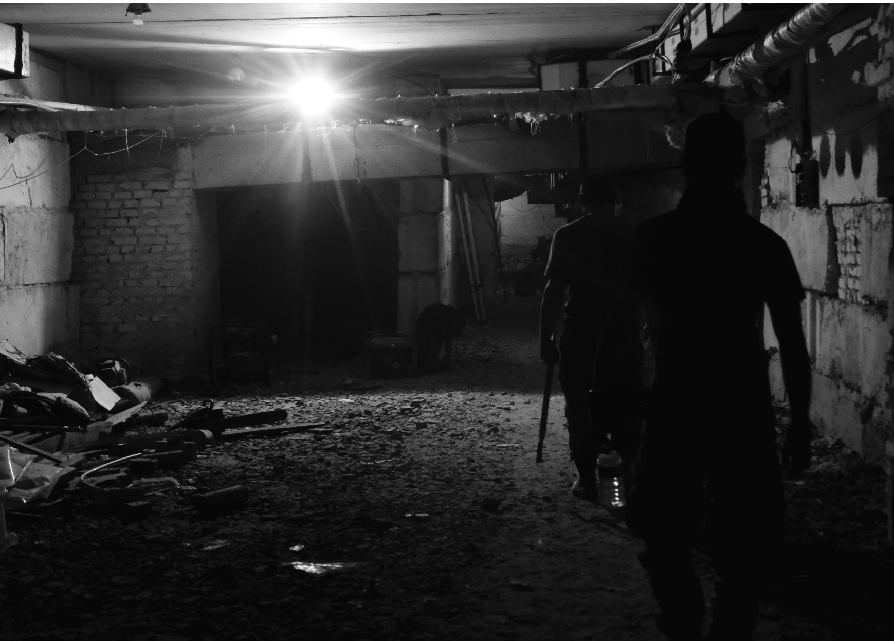
Bunker sur le front, sud d'Izioum, 09/08/22

Le sous-sol d'une école est devenu un bunker pour les soldats.