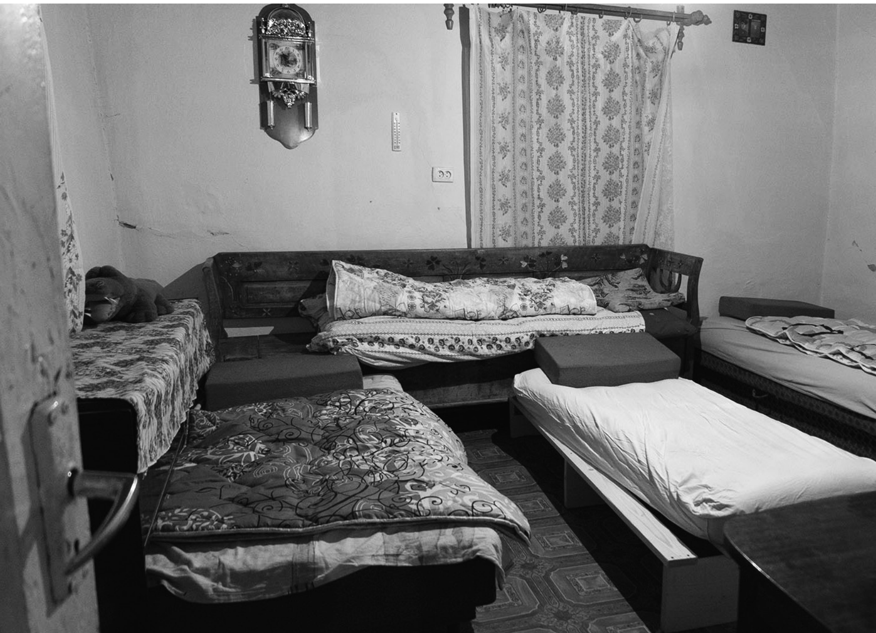
Ferme de Longo Mai, Hameau de Zeleny Hai, Nijnié Sélichtché, 19/03/22

Le dortoir est organisé pour les neuf personnes arrivant de France.