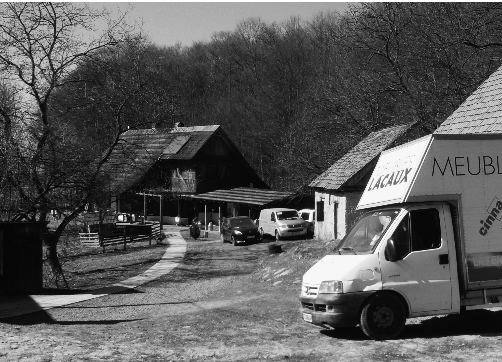
Ferme de Longo Mai, Hameau de Zeleny Hai, Nijnie Selychtché, 22/03/22

Arrivée à l'une des fermes de Longo Mai.