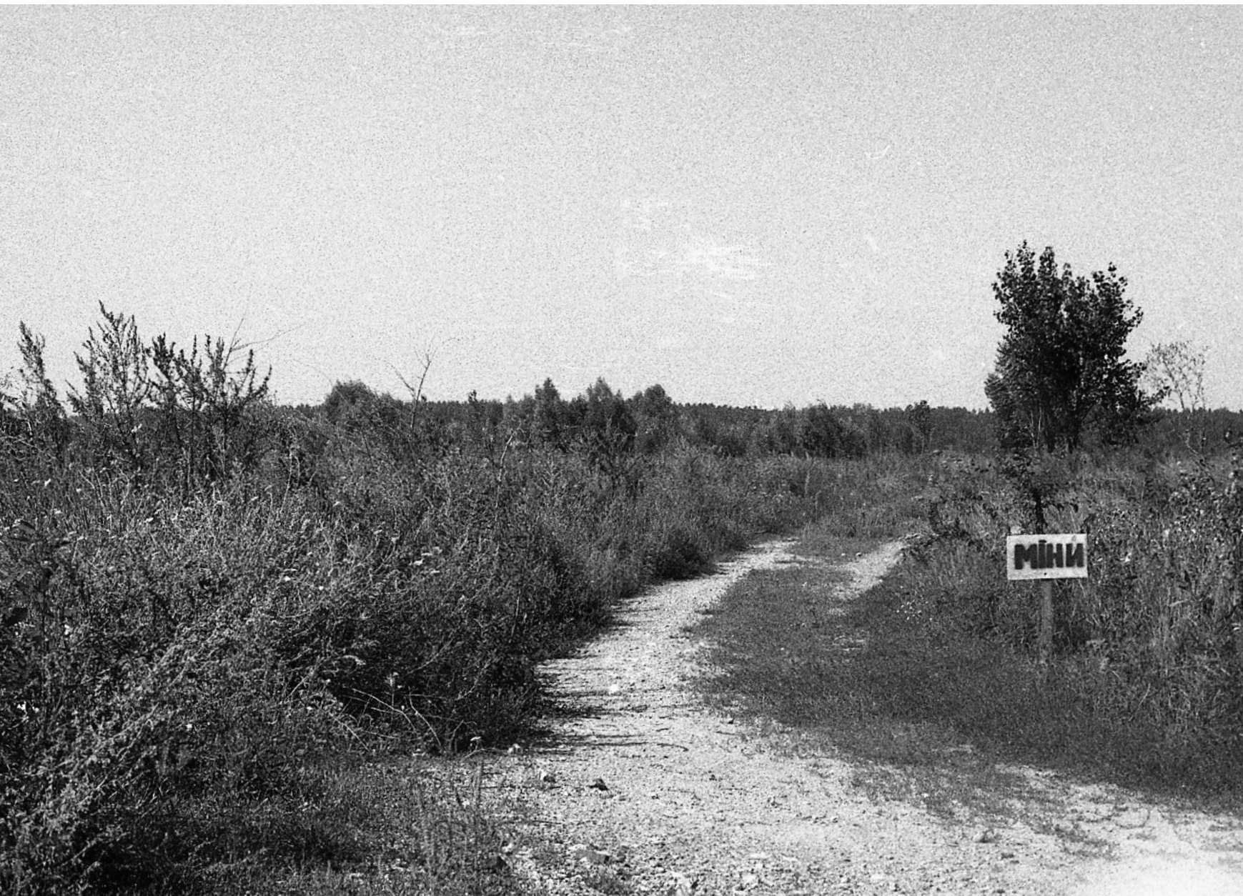
Au bord du village de Moshchun, nord-est de Kyiv, 30/07/22

Un des villages largement détruits pendant l'invasion russe de mars.