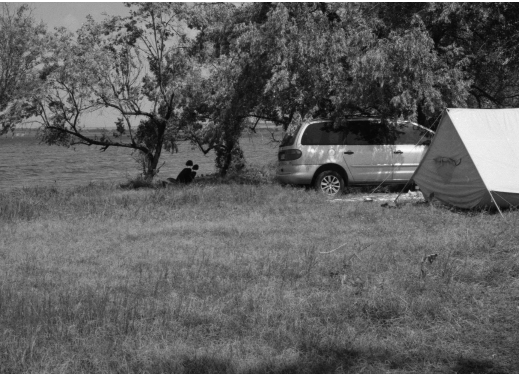
Au bord de la mer Noire, Osetrivka, 14/08/2022