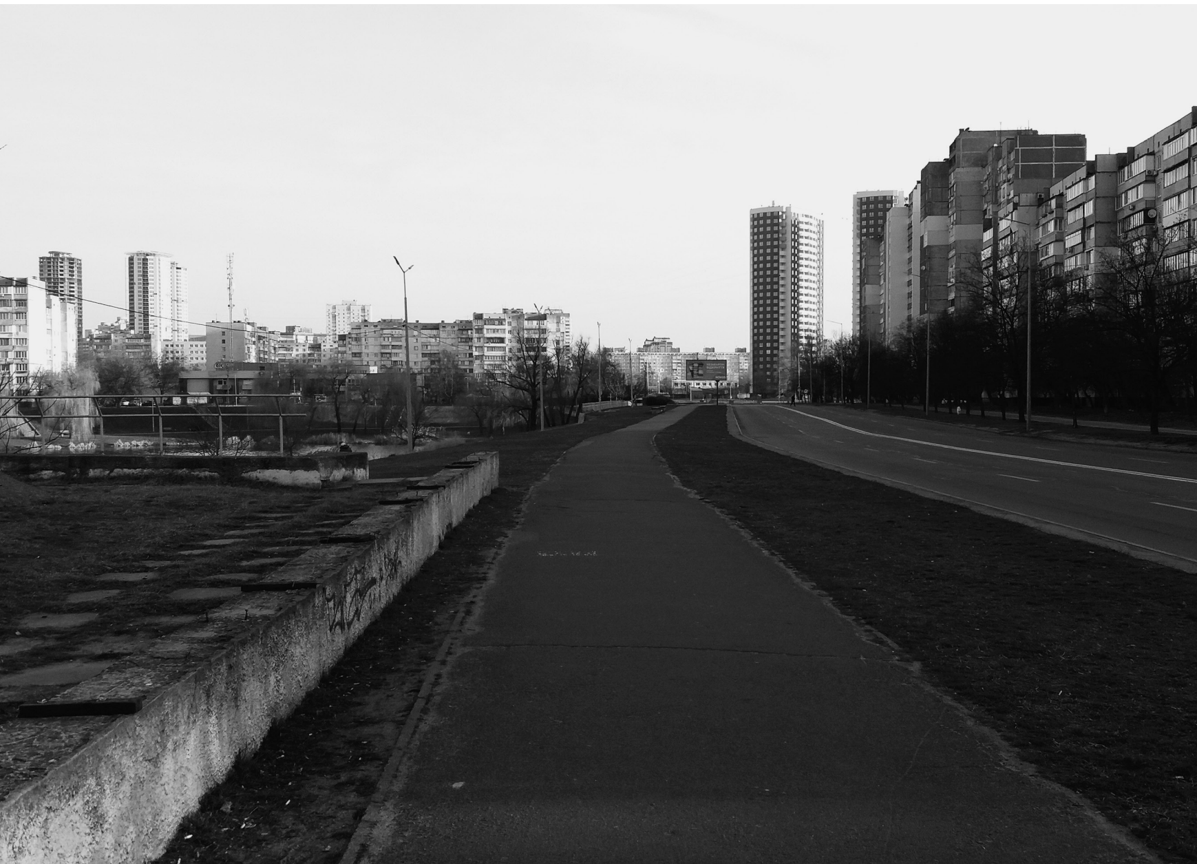
Rue Raiduzhna, Kyiv, 26/03/22

Kyiv déserte. Sept heures du matin, avant la livraison de l'ambulance.