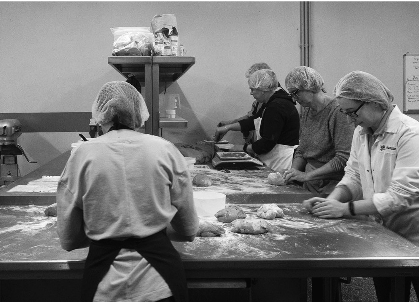
Atelier de fabrication de pain, Kyiv, 27/03/22

Le pain est ensuite distribué pour les civil-es resté-es dans la ville.