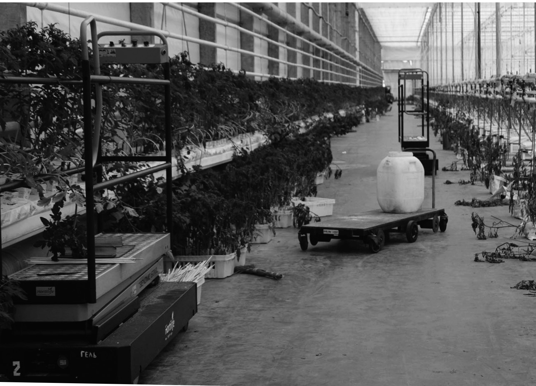
Serre de tomates et concombres, Brovary, 27/03/22

À l'arrêt depuis le début de la guerre, l'entreprise produit en temps normal plusieurs tonnes par an.