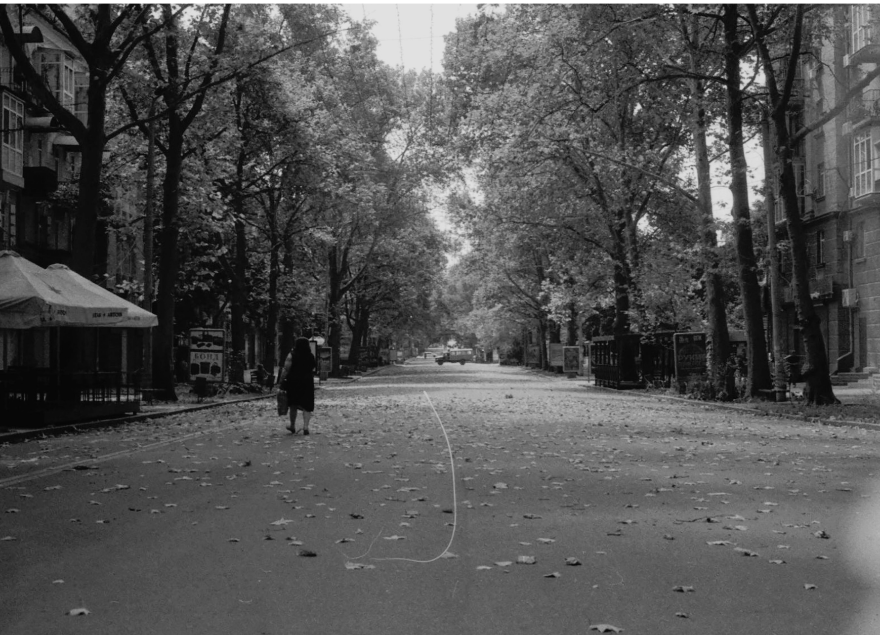
Centre-ville, Mykolaiv, 14/08/22

La ville est vide, le front est à quelques kilomètres.