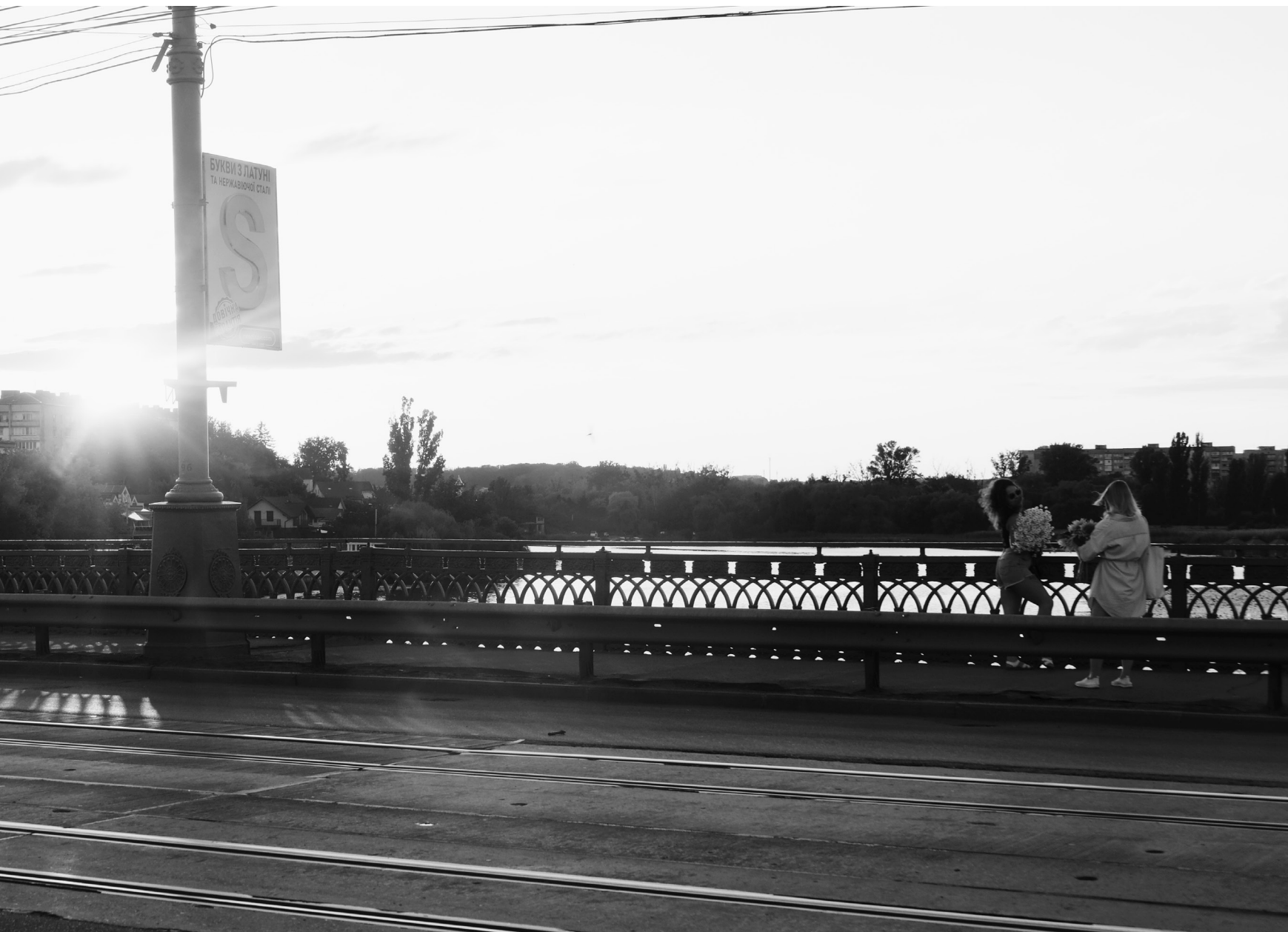
Pont Sorbona, Vinnytsia, 15/07/22

Non loin de l'attaque de missiles russes du 14 juillet ayant détruit plus de trente-six immeubles.