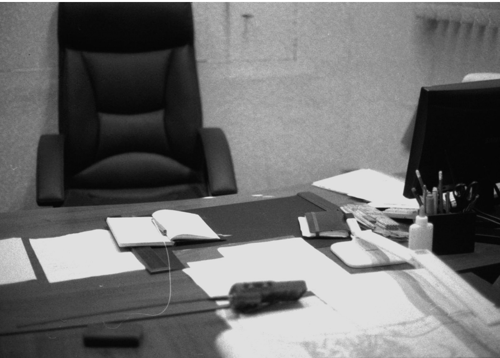
Bureau et cantine du bataillon, Barvinkove, 07/08/22

Proche de la ligne de front, ce village est devenu logement, refuge et lieu de vie pour les soldats.