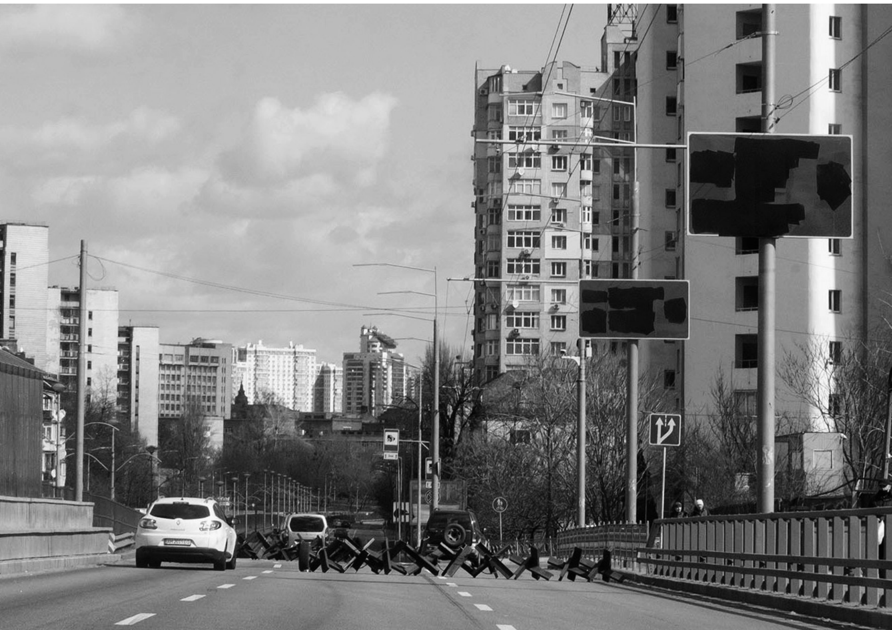
Voiture de Sergi, Industrial Bridge, Kyiv, 26/03/22

Rendez-vous pour mettre en place des cantines. Les panneaux d'indication sont noircis pour empêcher les soldats russes de se repérer dans la ville, des barrières anti-tanks sont installées.