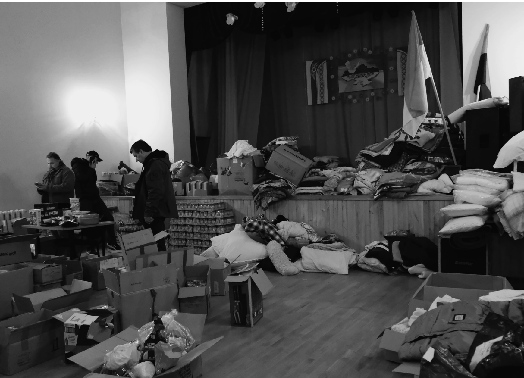
Salle de spectacle, Kossiv, 24/03/23

Le théâtre est devenu lieu de stockage pour les denrées humanitaires. À l'arrière, on fabrique des gilets pare-balles.