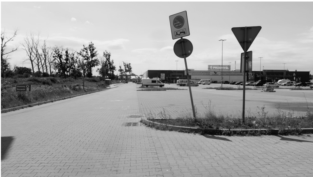
Parking Tesco, Przemysł(pl), 14/03/22 Le camp de déplacé-es s'est vidé.

Le nom des villes m'apparaissent à mesure qu'elles se font bombarder.