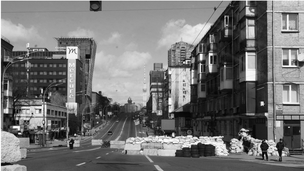
Voiture de Sergi, un checkpoint de Kyiv, 26/03/22 Rendez-vous pour mettre en place une cantine.