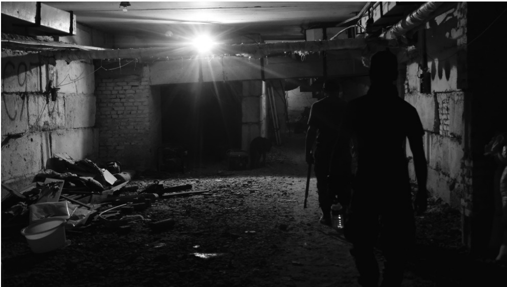
Bunker sur le front, sud d'Izioum, 09/08/22 Le sous-sol d'une école est devenu un bunker pour les soldats.