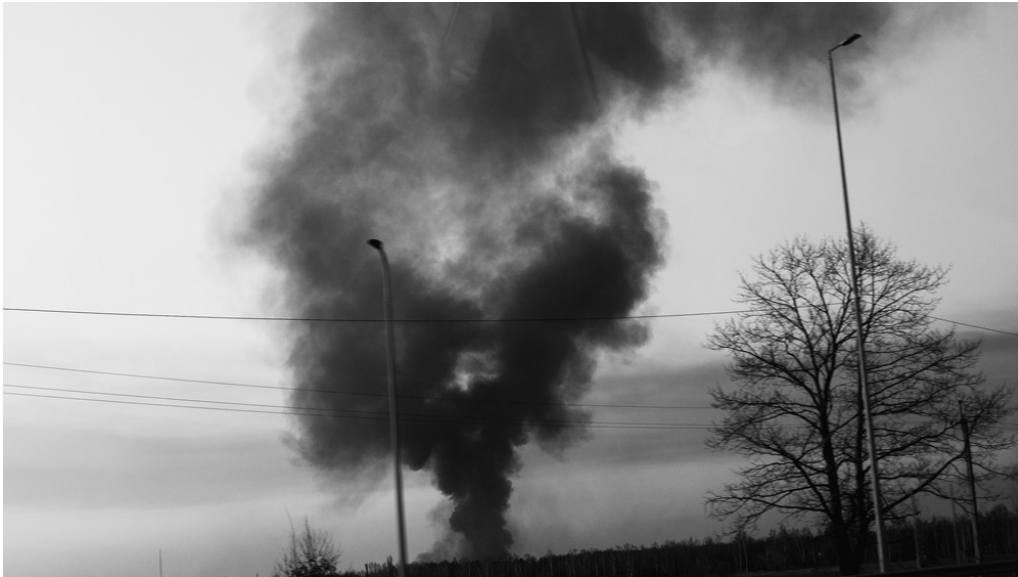
Arrivé en bordure de Kyiv, 23/03/22 Fumée d'une explosion de la veille.