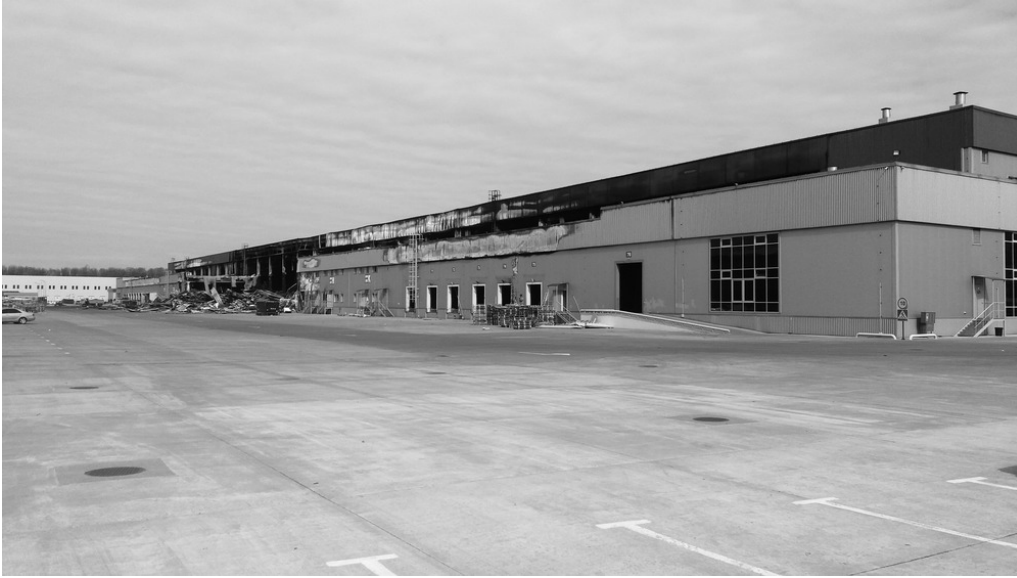
Plateforme logistique, Brovary, 26/03/22