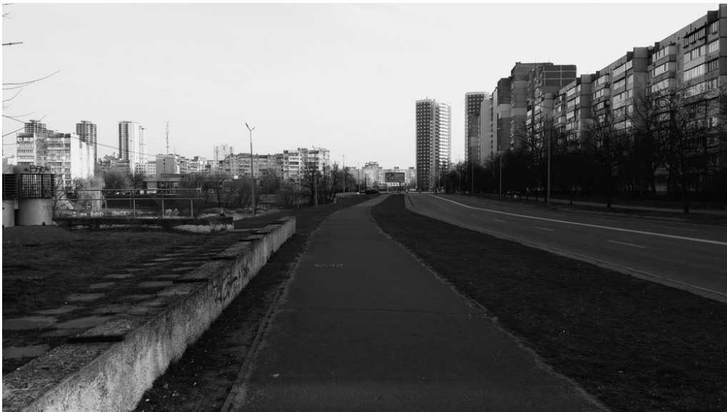
Rue Raiduzhna, Kyiv, 26/03/22 Kyiv déserte. Sept heures du matin, avant la livraison de l'ambulance.