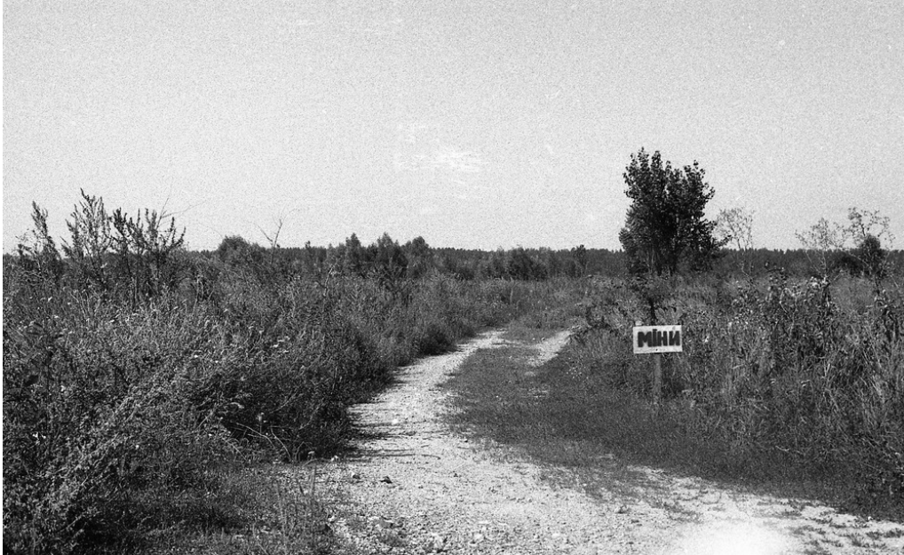
Au bord du village de Moshchun, nord-est de Kyiv, 30/07/22 Un des villages largement détruits pendant l'invasion russe de mars. « Mines »