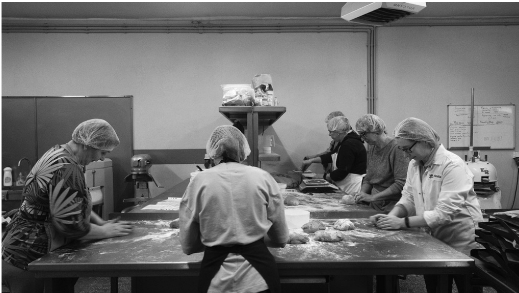
Atelier de fabrication de pain, Kyiv, 27/03/22

À l'arrêt depuis le début de la guerre, l'entreprise produit en temps normal plusieurs tonnes par an.