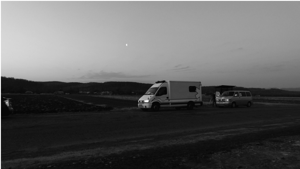
Route de campagne, Transcarpatie, 23/03/22 Trajet vers Kyiv pour la livraison de l'ambulance.

Les liens tissés entre personnes locales et réfugiées à l'intérieur de l'Ukraine depuis un mois ont conduit à des rencontres improbables. Nous ne pensions pas partager une nuit avec des pompiers dans une église, ni accepter la bénédiction d'un évêque évangéliste pour la fin de notre voyage. Nous pouvons espérer que tous ces réseaux d'entraide et d'organisation concrète par le bas puissent tisser des liens au-delà de l'absolue nécessité. Qu'ils soient assez solides et nombreux pour faire perdurer cette capacité d'auto-détermination qui avait déjà été une des promesses du Maïdan de 2014. Et ainsi de ne pas laisser l'ingérence, qu'elle soit russe ou occidentale, décider de l'avenir des habitantes d'Ukraine.