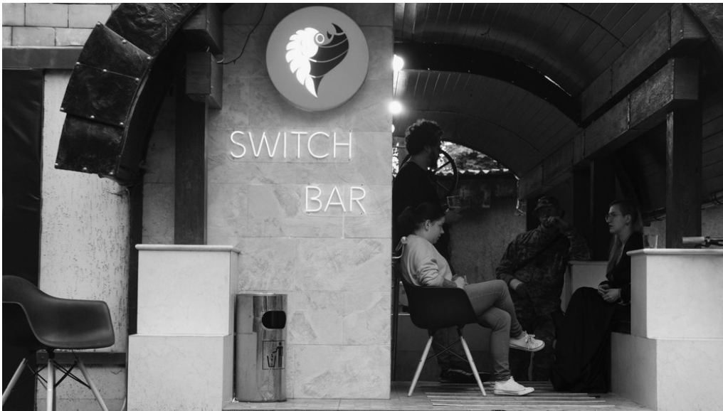
Switch Bar, Kharkiv, 20/07/22 Un groupe de jeunes volontaires vit dans le bar depuis le début de la guerre.