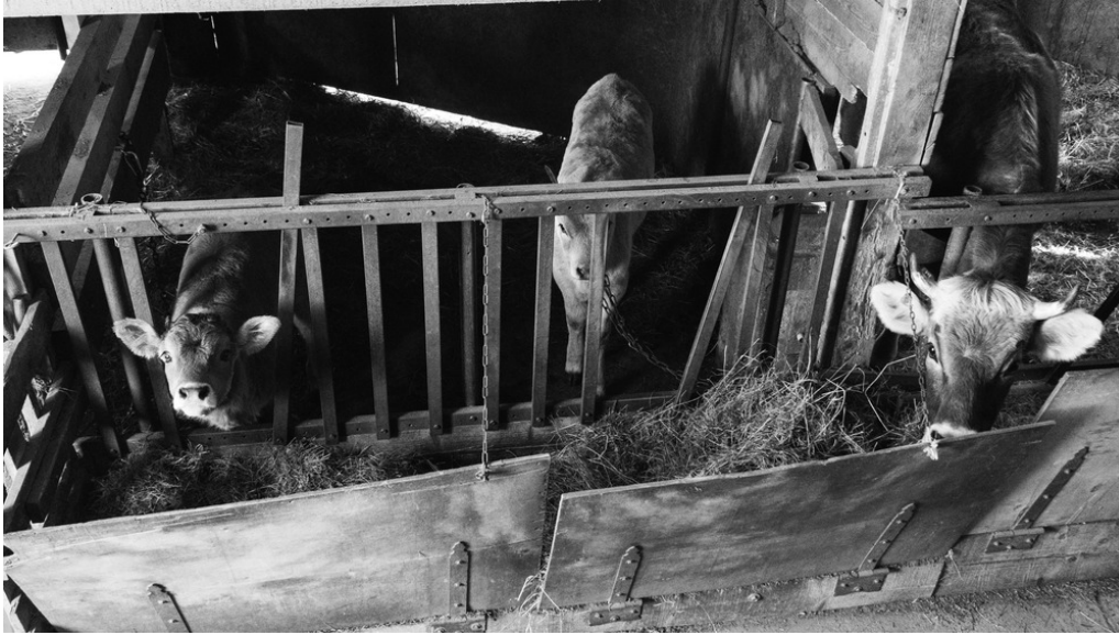
Ferme de Longo Maï, Hameau de Zeleny Haï, Nijnié Sélichtché, 18/03/22 Les animaux de la ferme sont nourris par les volontaires.