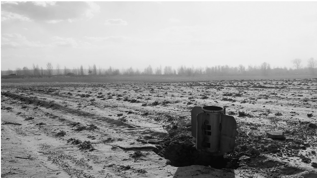
Skybyn, nord de Kyiv, 27/03/22