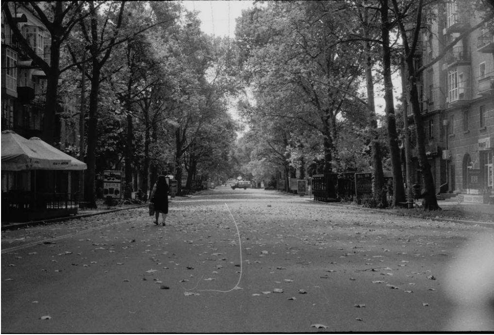
Centre-ville, Mykolaiv, 14/08/22 La ville est vide, le front est à quelques kilomètres.