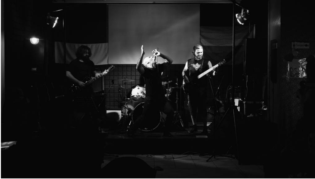
Switch Bar, Kharkiv, 23/07/22

Un concert est organisé avant le couvre-feu. Volontaires, militaires et ami·es s'y retrouvent.