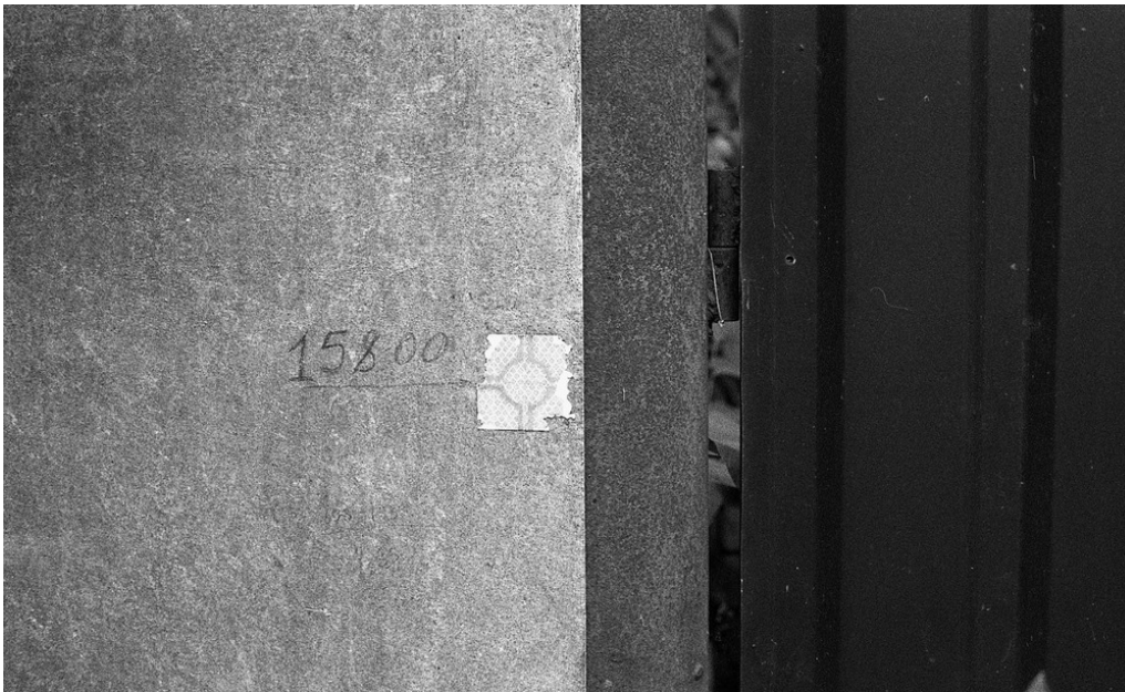
Voiture de Sergi, un checkpoint de Kyiv, 26/03/22 Rendez-vous pour mettre en place une cantine.