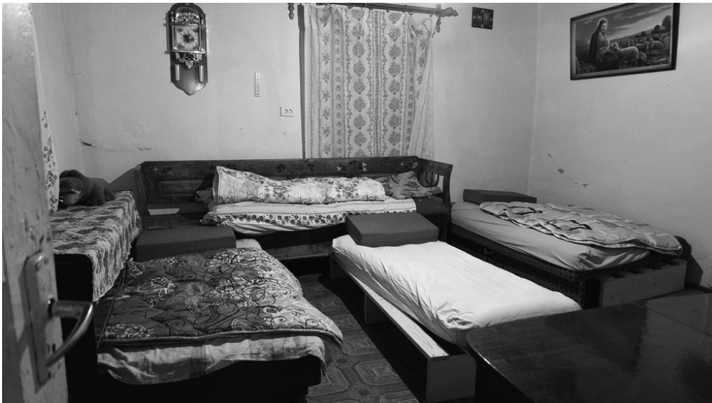
Ferme de Longo Maï, Hameau de Zeleny Haï, Nijnié Sélichtché, 19/03/22 Le dortoir est organisé pour les neuf personnes arrivant de France.