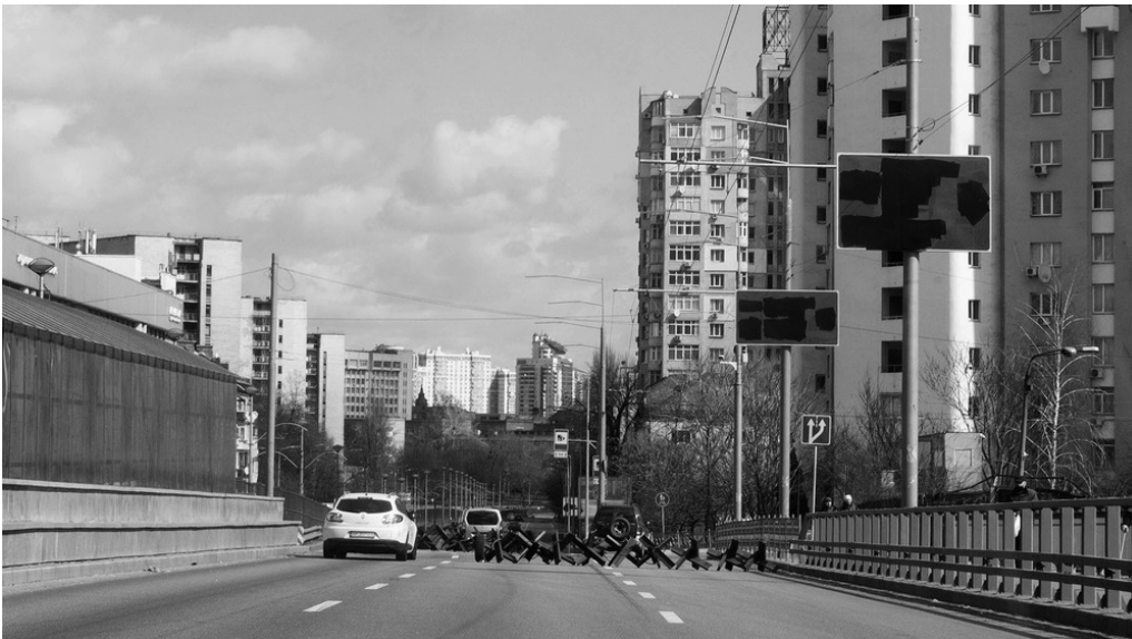
Voiture de Sergi, Industrial Bridge, Kyiv, 26/03/22 Rendez-vous pour mettre en place des cantines. Les panneaux d'indication sont noircis pour empêcher les soldats russes de se repérer dans la ville, des barrières anti-tanks sont installées.