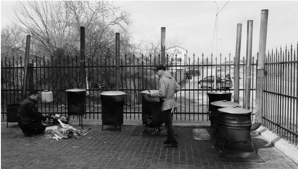
Lac de Radunka, près de l'église évangéliste Druzy Christa, rue Raiduzhna, Kyiv, 26/03/22 La soupe du midi se prépare pour les habitant-es du quartier.