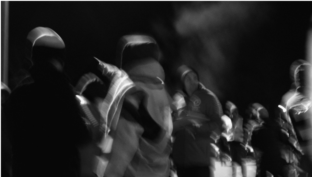
Parking Tesco, Przemysł (pl), 04/03/22

Non loin de l'attaque de missiles russes du 14 juillet ayant détruit plus de trente-six immeubles.