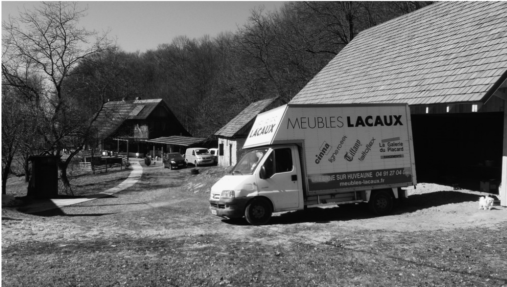
Ferme de Longo Maï, Hameau de Zeleny Haï, Nijnié Sélichtché, 22/03/22 Arrivée à l'une des fermes de Longo Maï.