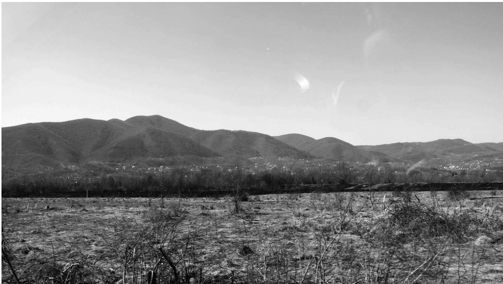
Route de campagne, Transcarpatie, 23/03/22

Dans chaque classe de l'école sont organisés des dortoirs pour les déplacé-es des zones bombardées.