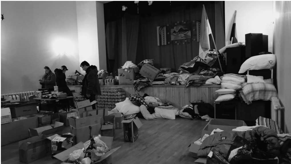
Salle de spectacle, Kossiv, 24/03/33

Une école est aménagée en dortoir pour les déplacés des zones bombardées.