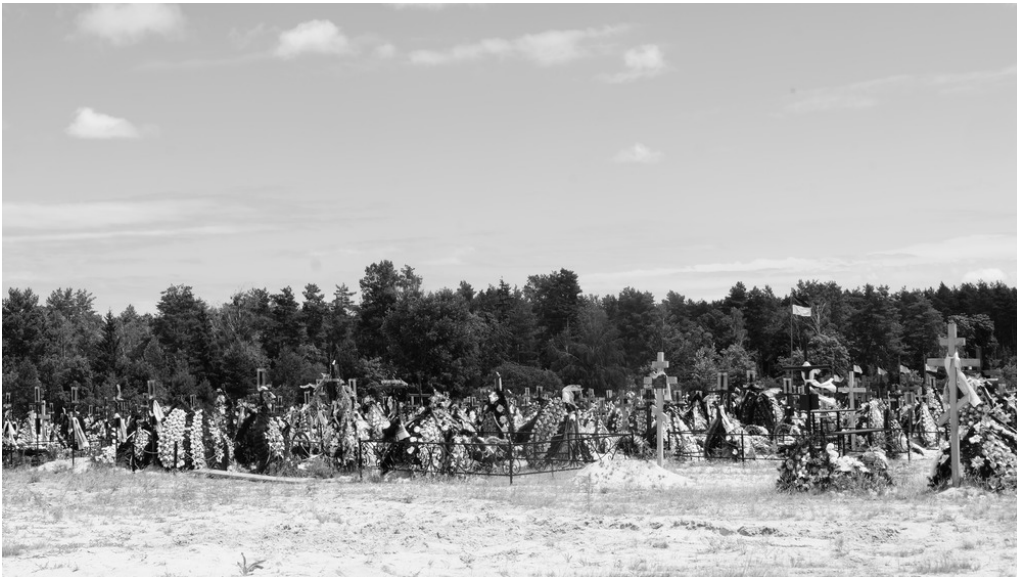
Cimetière, Irpin, 19/08/22