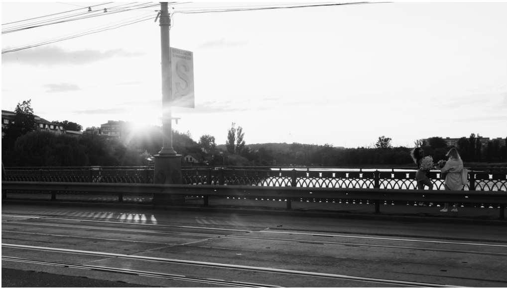
Pont Sorbona, Vinnystia, 15/07/22

place, la forme masculine est utilisée : ainsi pour la police, les groupes d'extrême-droite et l'armée régulière, c'est le masculin qui est choisi, tandis que pour les volontaires, c'est le féminin.