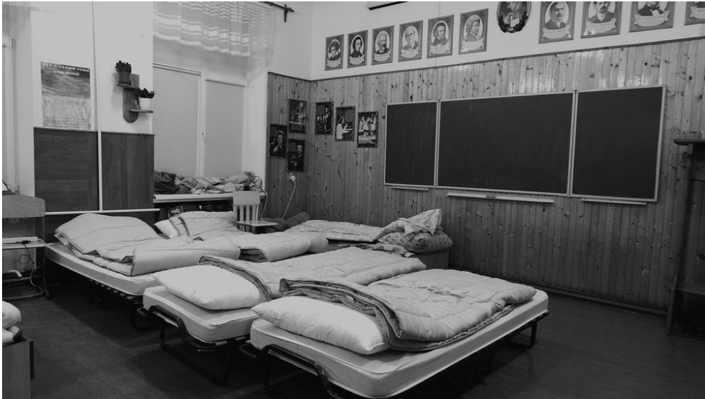
École, Kossiv, 24/03/22

Une école est aménagée en dortoir pour les déplacés des zones bombardées.