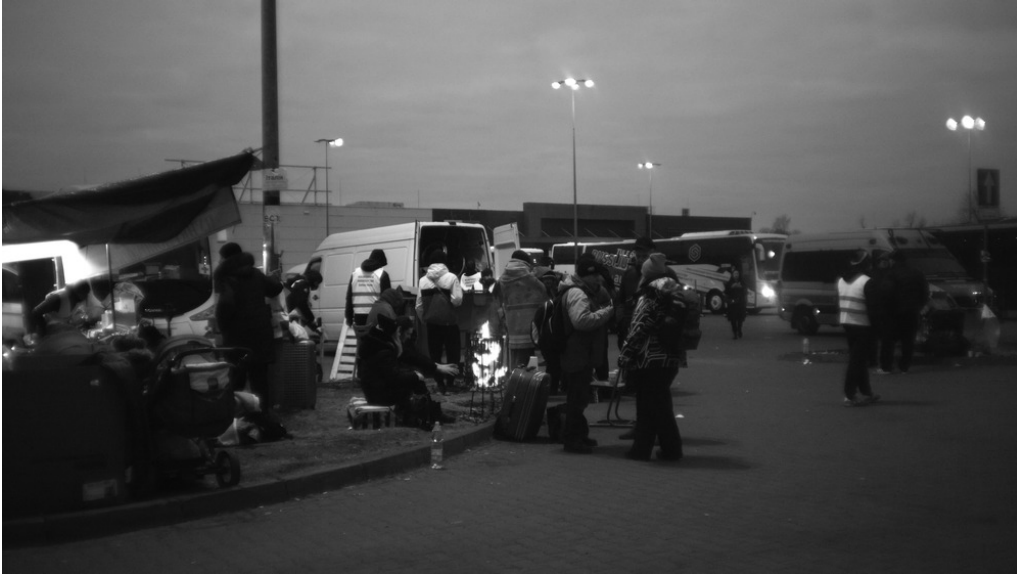
Parking Tesco, Przemysł (pl), 10/03/22 Camp d'attente des déplacé-es.