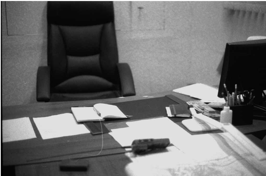
Bureau et cantine du bataillon, Barvinkove, 07/08/22

Un concert est organisé avant le couvre-feu. Volontaires, militaires et ami·es s'y retrouvent.