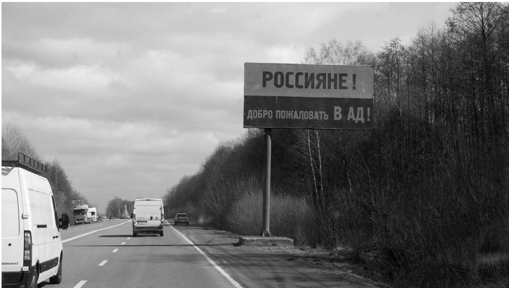
Route vers Kyiv, 25/03/22 « Russes, bienvenues en enfer »