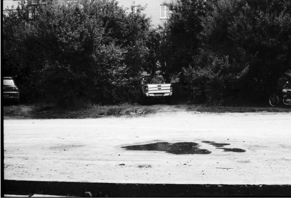
Rue du village, Barvinkove, 08/08/22 Les ateliers de camouflage de Kossiv prennent tout leur sens.