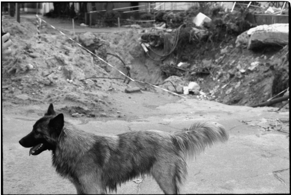
Au bordure de la ville, Mykolaïv, 13/08/22 Les dégâts d'un missile S-300.