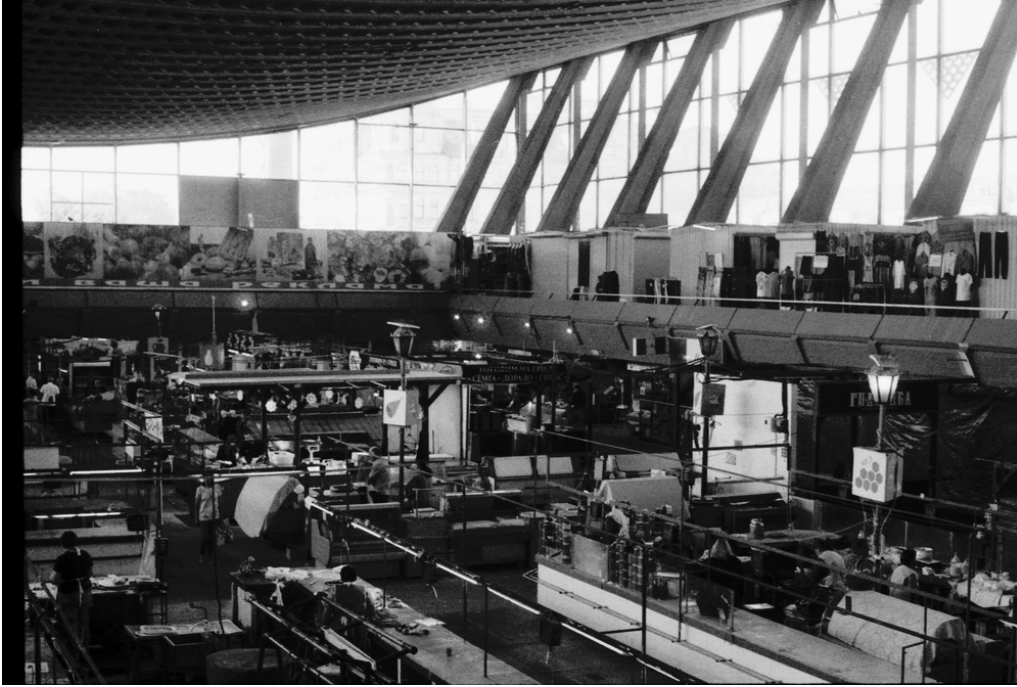
Marché de Zhytniy, Kyiv, 25/07/22 Le quartier de Podil a repris ses activités.