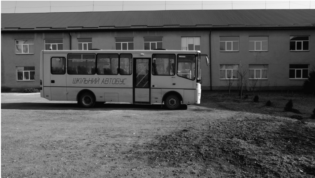
École, Nijnié Sélichtché, 20/03/22

Dans chaque classe de l'école sont organisés des dortoirs pour les déplacé-es des zones bombardées.