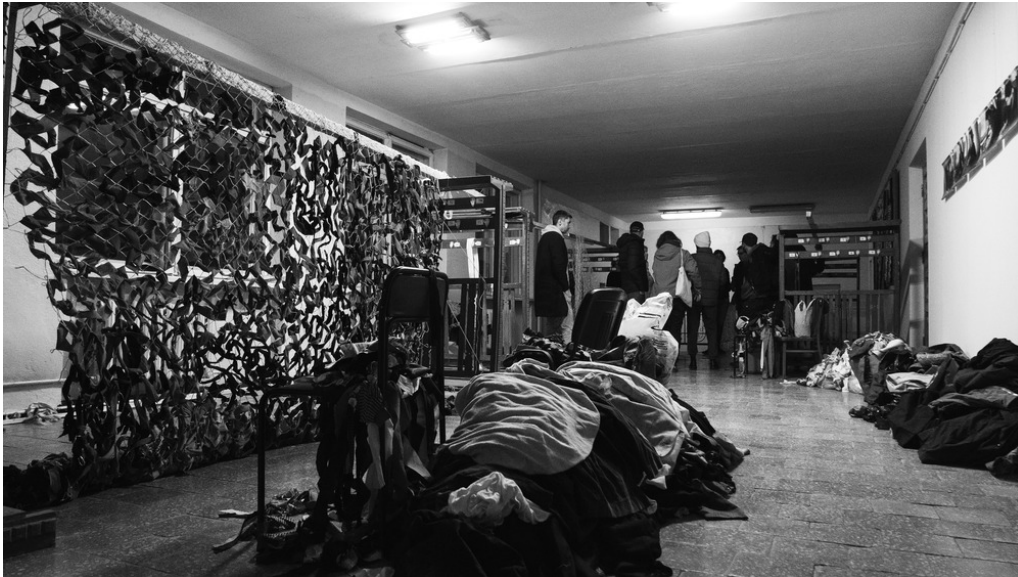
Musée, Kossiv, 24/03/22 À l'étage du musée, un atelier fabrique des filets de camouflage.