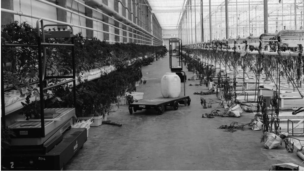
Serre de tomates et concombres, Brovary, 27/03/22

À l'arrêt depuis le début de la guerre, l'entreprise produit en temps normal plusieurs tonnes par an.