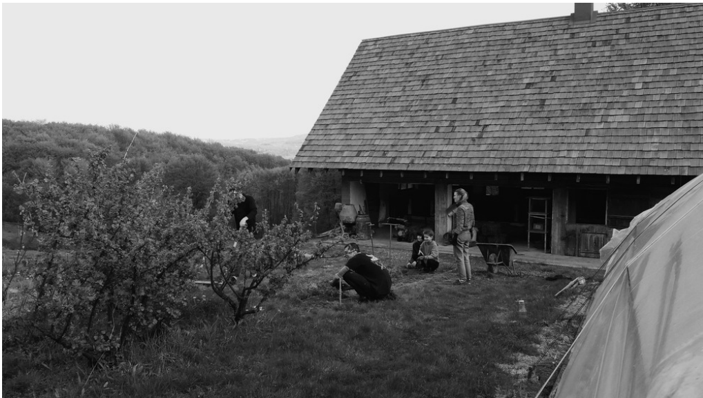
Ferme de Longo Maï, Hameau de Zeleny Haï, Nijnié Sélichtché, 20/04/22 Des jeunes de Kyiv aident à travailler la terre.