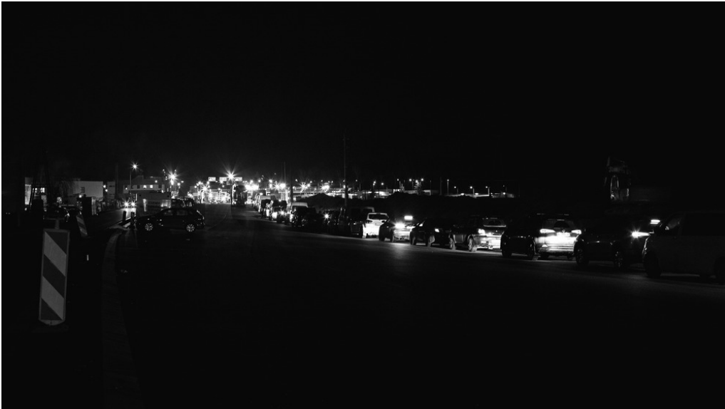
Frontière, Medyka (pl), 11/03/22 Les voitures font la file pour entrer en Ukraine.